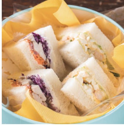
2種のサンドイッチ 750円 税込