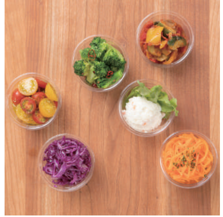
お惣菜4種のボックス 650円 税込