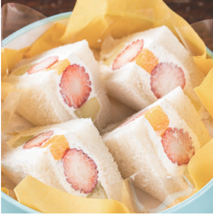
季節のフルーツサンド 1,200円 税込