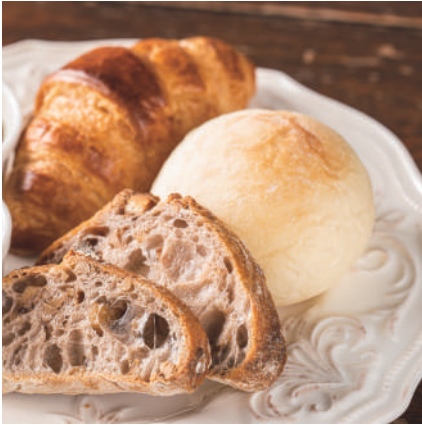
パン盛り合わせ 500円 税込